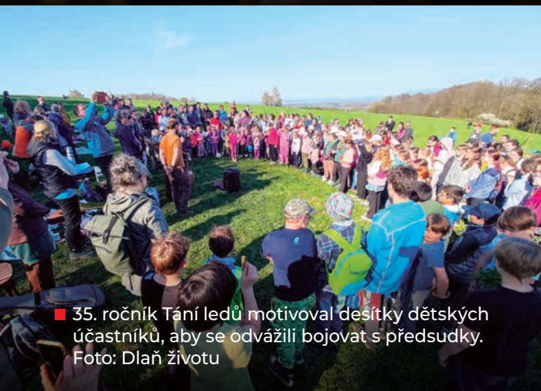
■ 35. ročník Tání ledů motivoval desítky dětských účastníků, aby se odvážili bojovat s předsudky.