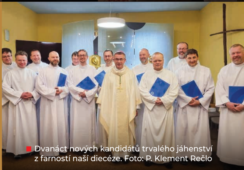
■ Dvanáct nových kandidátů trvalého jáhenství z farností naší diecéze.