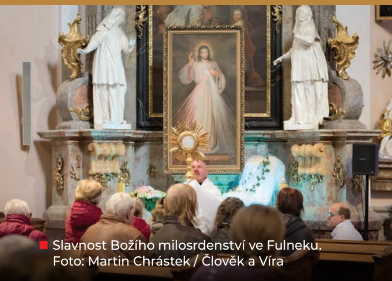
■ Slavnost Božího milosrdenství ve Fulneku.