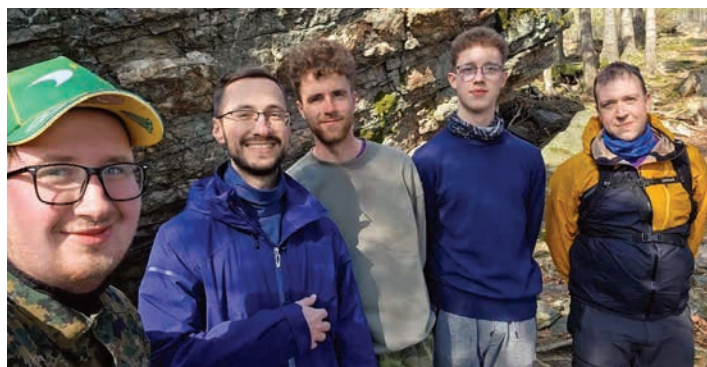
■ Dubnová Pánská jízda se střediskem mládeže na Rejvízu.