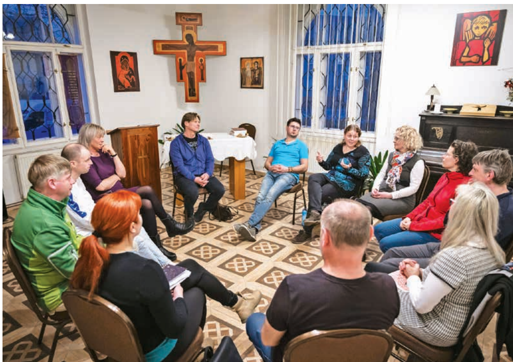
■ Kurz Život v Duchu v Ostravě-Radvanicích propojil různé generace i farnosti.