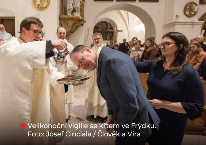
■ Velikonoční vigilie se křtem ve Frýdku.