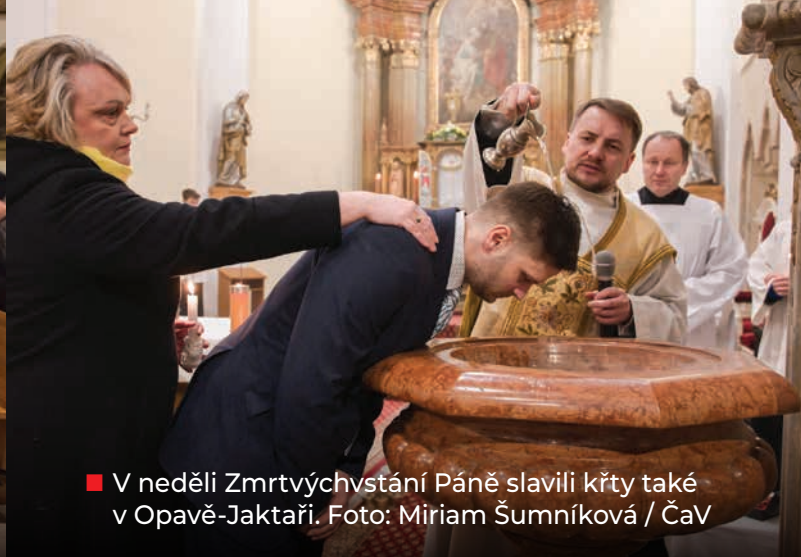
■ V neděli Zmrtvýchvstání Páně slavili křty také v Opavě-Jaktaři.