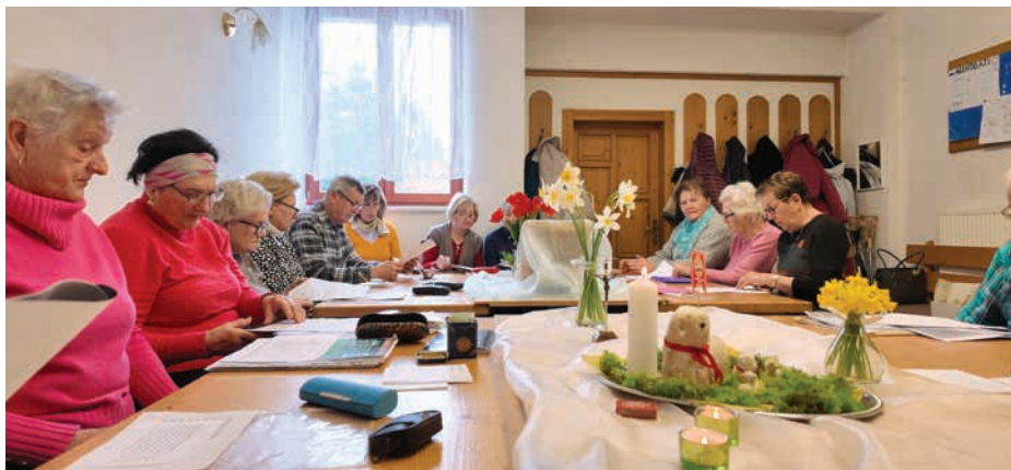
■ Velikonoční zátíší, brýle ke čtení a rozjímání nad Bibli uprostřed společenství seniorů.