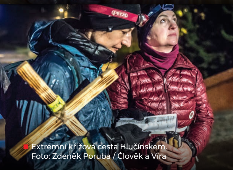
■ Extrémní křížová cesta Hlučínkem.