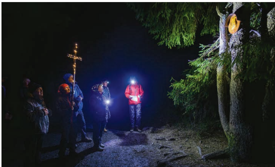
■ Noční cesta po hřebeni Radhoště s osvětleným křížem a čelovkami.