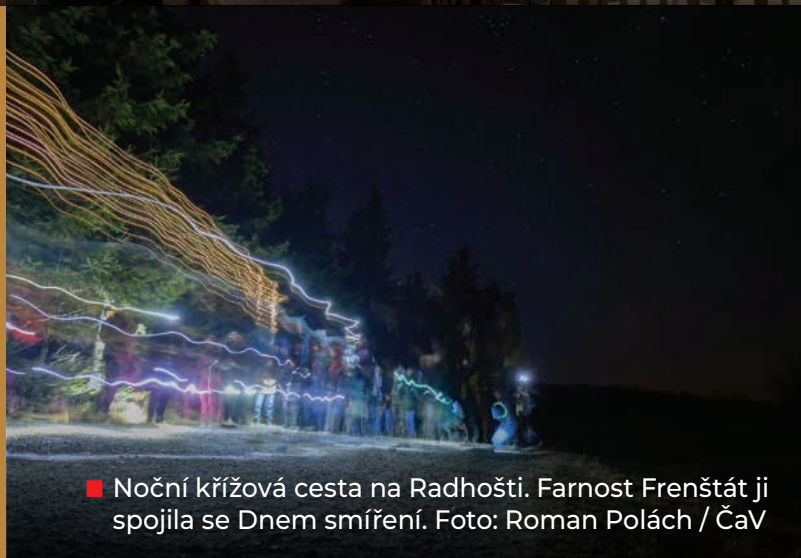
■ Noční křížová cesta na Radhošti. Farnost Frenštát ji spojila se Dnem smíření.