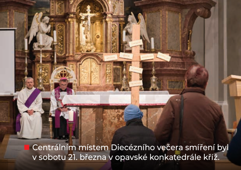
■ Centrálním místem Diecézního večera smíření byl v sobotu 21. března v opavské konkatedrále kříž.