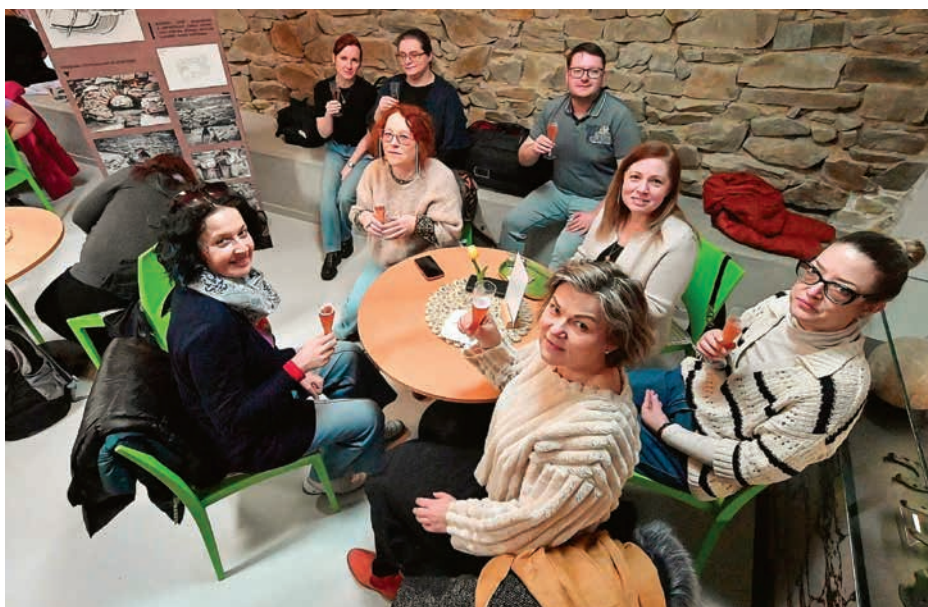
■ Charitní kavárna první den v provozu praskala ve švech.

Kavárna pro radost, ve které obsluhují klienti s duševním onemocněním nebo mentálním znevýhodněním, si získala srdce mnoha lidí během dvou let, kdy měla otevřeno každé úterý v opavském obchodním centru Breda&Weinstein. Když musela loni v září skončit, zdálo se, že nové vhodné prostory už nenajde. Pak ale přišla nabídka Slezského zemského muzea a smutek klientů Radosti, že se budou muset své oblíbené role číšníků vzdát, se rozplynul. Protože ale od uzavření původních prostor uteklo půl roku, panovala obava, nakolik si klientela této netypické kavárny najde cestu do nového sídla. Naštěstí se ukázalo, že žádná skepse nebyla na místě. K původním stamgastům se přidali noví návštěvníci