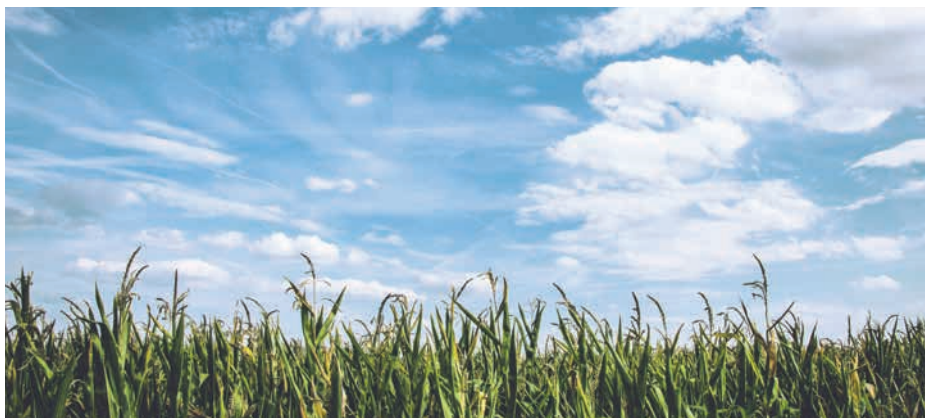
■ 10 % ze zisku z úrody dává pan Radim na církevní a charitativní projekty.

„Ta slova mi vstoupila hluboko do srdce. Pracuji v zemědělství, a tak jsem