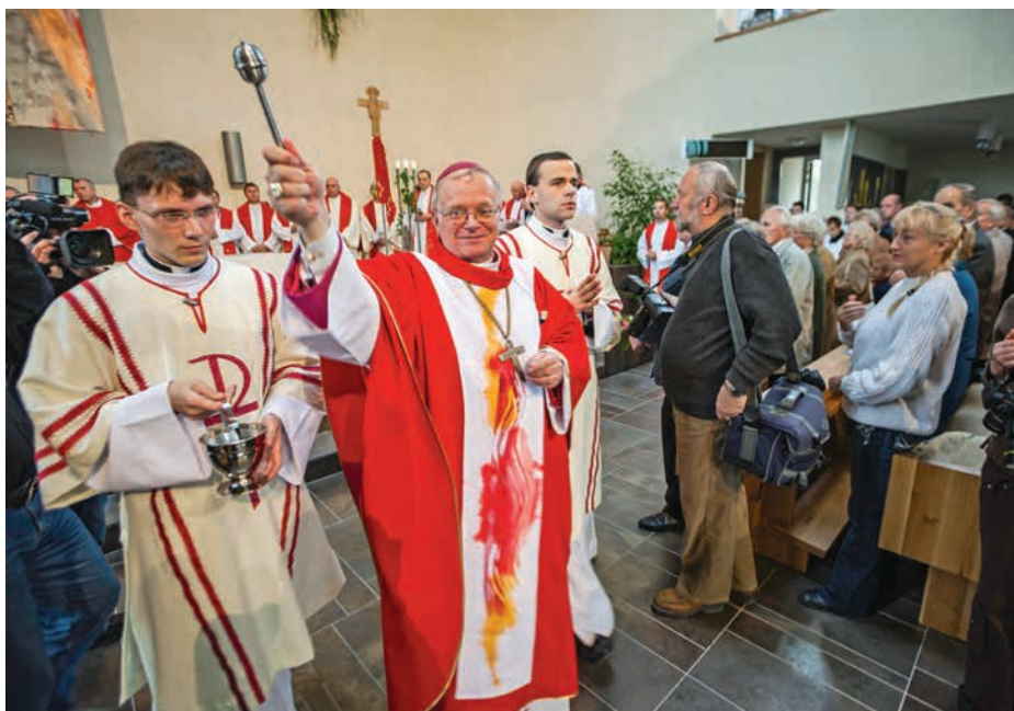
■ Svěcení kostela svatého Ducha v Ostravě-Zábřehu. Důležitý moment nejen pro další duchovní příběh jižní části Ostravy.

16. května hostilo poutní místo Maria Hilf 1. pouť kněží a jáhnů .