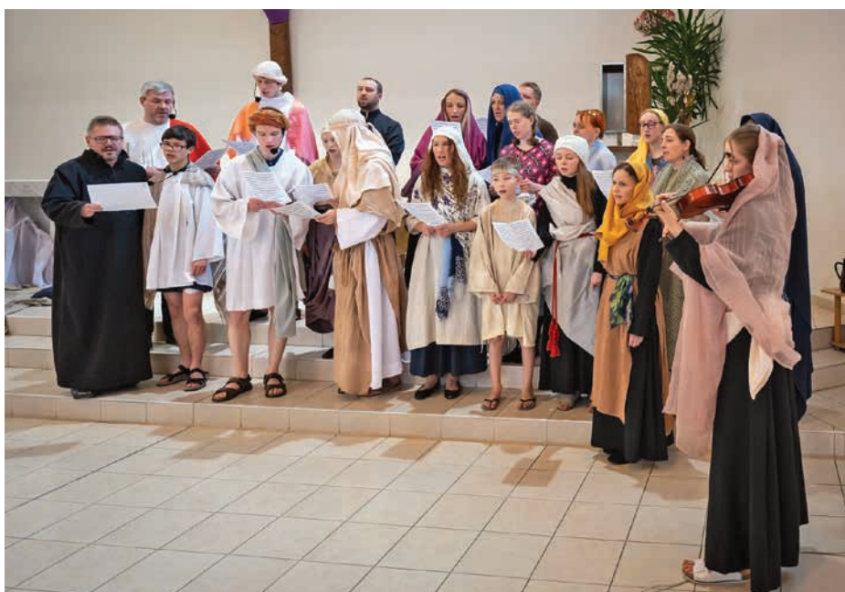
■ Pašije spojují více generací a pomáhají farnost spojit.