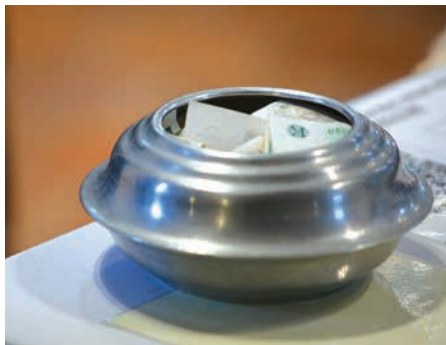
■ Štědrost je odpovědí člověka na Boží dary.

Vůbec první zmínku o „desátku“ přináší 14. kapitola knihy Genesis, kdy Abrahám dává „desátek ze všeho“