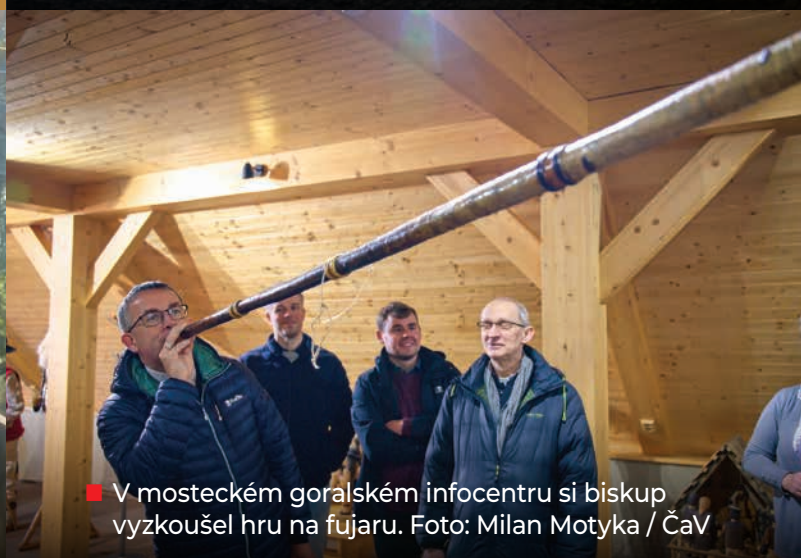
■ V mosteckém goralském infocentru si biskup vyzkoušel hru na fujaru.