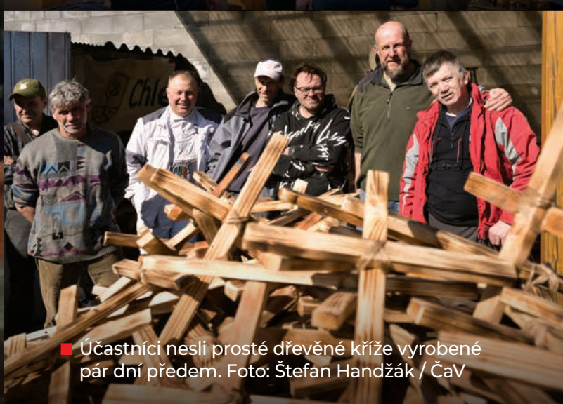
■ Účastníci nesli prosté dřevěné kříže vyrobené pár dní předem.