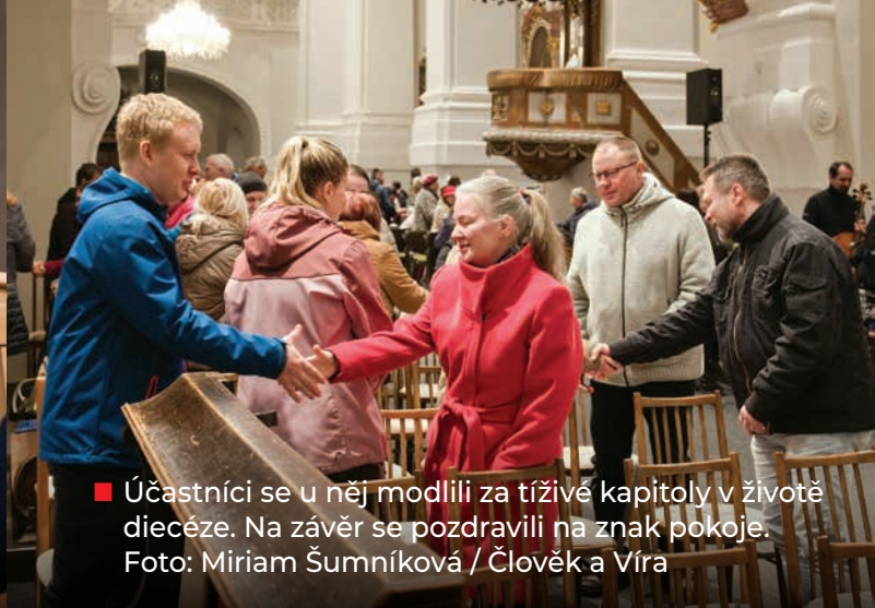
■ Účastníci se u něj modlili za tíživé kapitoly v životě diecéze. Na závěr se pozdravili na znak pokoje.