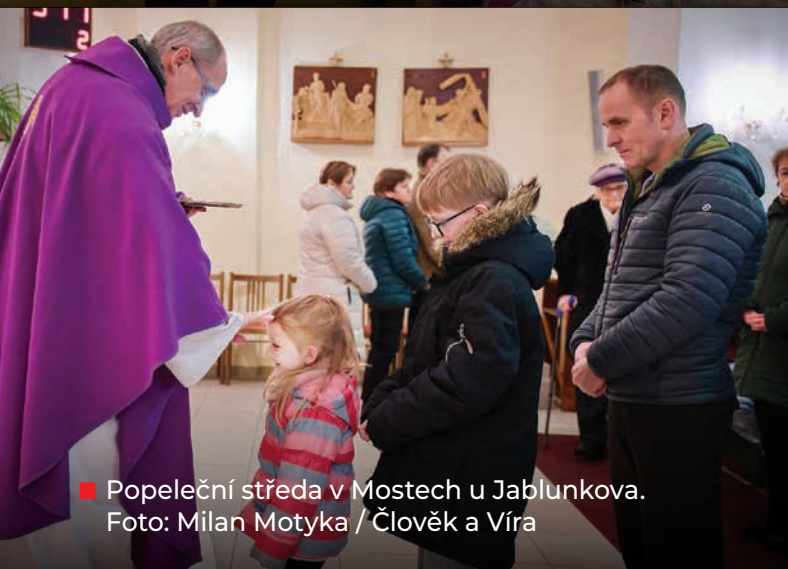
■ Popeleční středa v Mostech u Jablunkova.