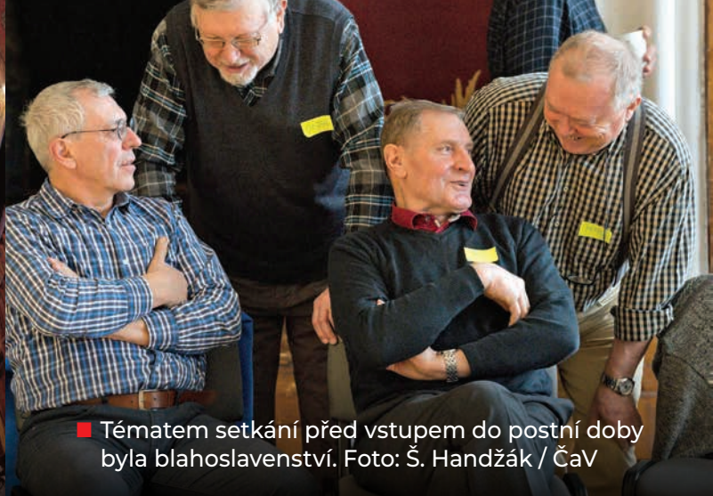
■ Tématem setkání před vstupem do postní doby byla blahoslavenství.