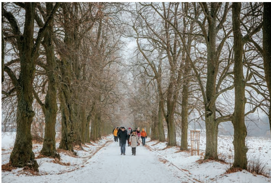
■ Při cestě smíření nás čeká náročný výstup, při kterém se zadýcháme. Výhledy, které uvidíme, ale budou stát za to.

Řekl bych, že je to jedna z nejtěžších věcí v životě. Jedná se vlastně o přijetí sebe samého, takového, jaký jsem. Tedy přijetí vlastní životní historie – do jaké doby jsem se narodil, co si nesu v genech od svých rodičů, co všechno mě v životě formovalo (a deformovalo). Už smíření s těmito skutečnostmi není jednoduché, ale pokud se v životě chceme někam posunout, nic jiného nám nezbývá. Pak jde o přijetí toho, co jsem v životě dosáhl, i toho, co se mi naopak nepovedlo a kde jsem šlápl vedle. Ne vždy to mohla být jen moje vina a občas je potřeba si poctivě říct, jaký podíl viny