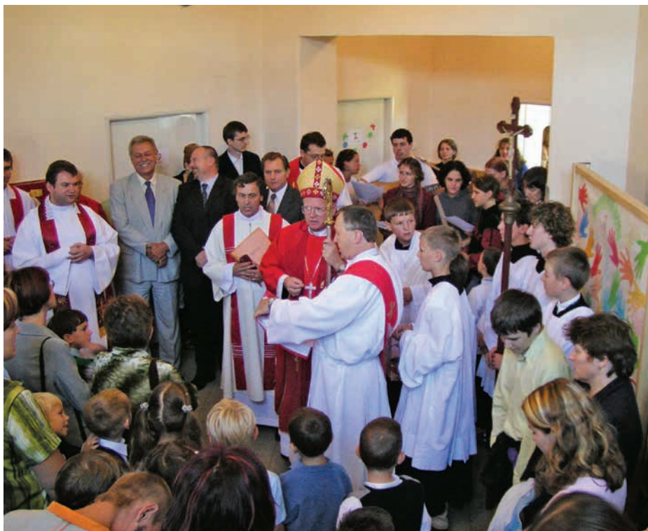
■ 1. září 2004 nastoupily děti poprvé do opavské pobočky Církevní základní školy sv. Ludmily. Budově i dětem požehnal biskup Lobkowicz a o šest týdnů později požehnal také školní kapli.

27. září 2003 se více než 2 000 věřících shromáždilo v ostravské katedrále, kde