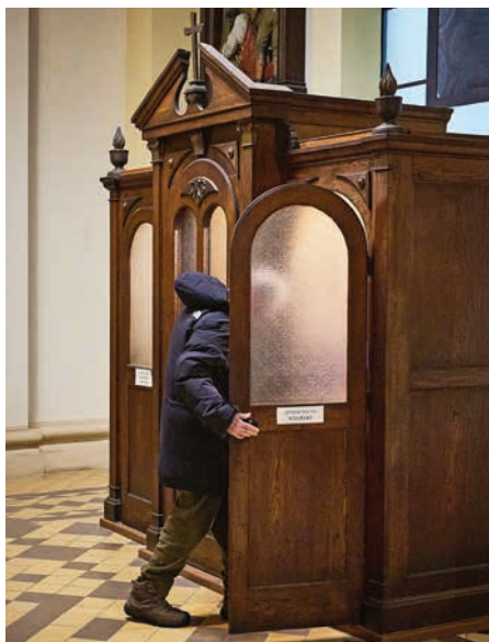
■ Zpovědní služba v katedrále již deset let zve ke smíření s Bohem.

Zároveň se zpovědní služba rozšiřuje i mimo Ostravu. V Českém Těšíně bude k dispozici každý čtvrtek od 9 do 12 a od 13 do 16 hodin. V Opavě, v konkatedrále