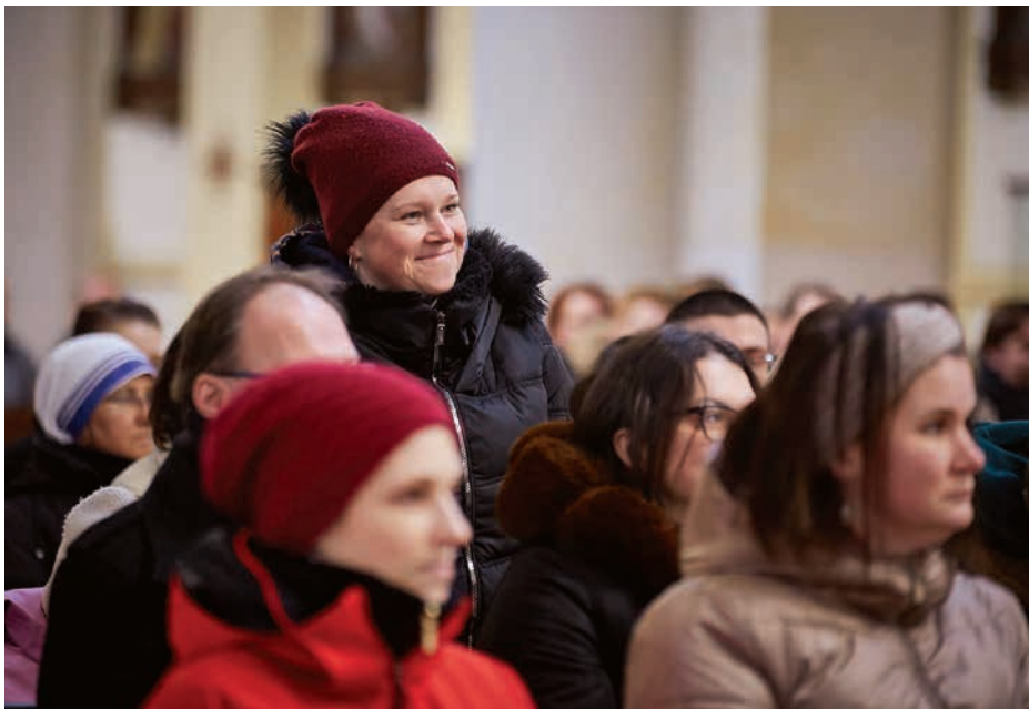
■ Představování katechumenů při bohoslužbě v katedrále.

jsem vždycky měl zájem o filozofii, religionistiku a humanitní vědy. Když jsem je začal blíže studovat, tak jsem racionálně došel k závěru, že Bůh musí nějakým způsobem existovat. Začal jsem zjišťovat více o náboženství, jestli jsou nějaké zázraky, které jsou vědecky potvrzené. Bral jsem to vše tak nějak racionálně a vědecky. Chybělo tam srdce. Doopravdy se mě Bůh dotkl, když mi zemřela spolužačka. Bylo to těsně před Vánoce. Chodili jsme spolu do třídy asi šest let. Její smrt mě zasáhla. Šel jsem do kostela k betlému, věděl jsem, že v katedrále bývá už před Vánoce. A pak to najednou přišlo. Jako blesk z čistého nebe. Najednou jsem věděl, že Bůh je. A rozhodl jsem se, že se chci nechat pokřtít.“