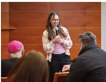
■ Účastníci po mši svaté sdělili své příběhy v sále biskupství a vyslechli katechezi.