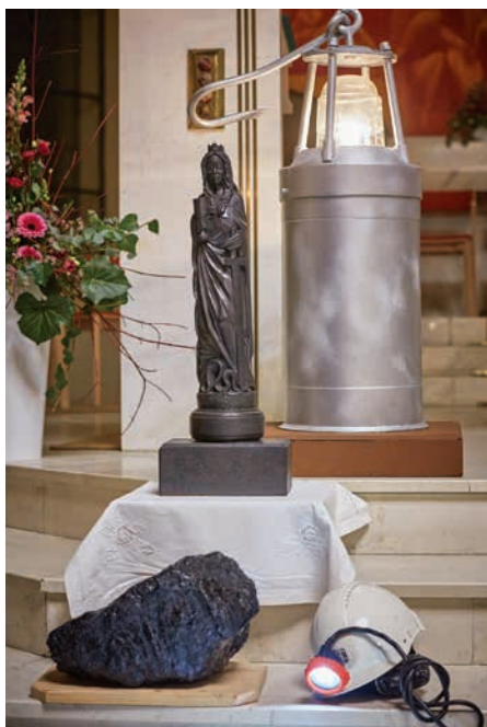
■ Socha sv. Barbory, kahan, uhlí a helma před ambonem v katedrále.

To víte, chlapi se tam projevovali, jak umí. Na šichtě se kterýsi z nich rozčiloval: „Já jsem byl na pohřbu a ten farář tam tak dlouho kázal!“ Tak já jsem mu odpověděl: „A co by měl jiného dělat, on má přece kázat Boží slovo.“ Další zase po nějaké době: „Já jsem byl na pohřbu a tam ten farář nejen dlouho kázal, ale potom ještě vybíral peníze!“ A já zas na to: „No to nemohl být farář. Ten, kdo vybíral peníze, to byl určitě kostelník