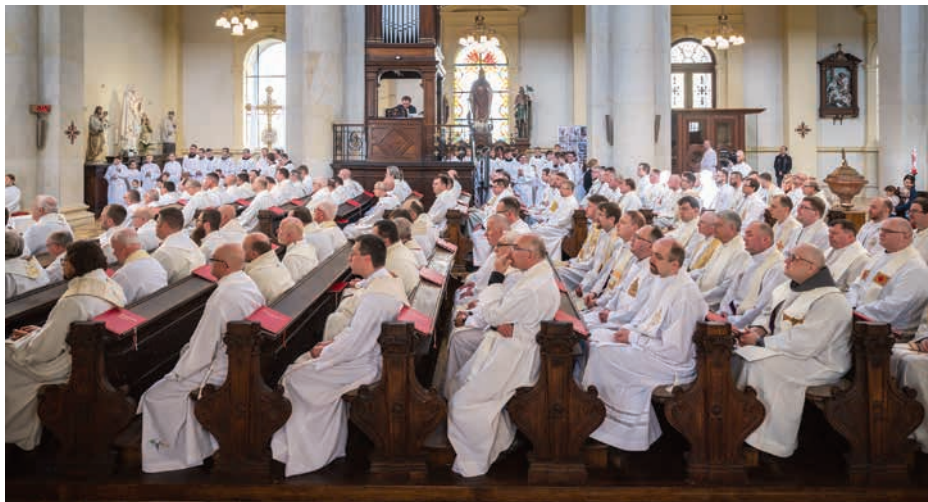
■ Fond MOST stojí na solidaritě. Příspěvky pomáhají zajistit mzdy všech kněží v diecézi.

Každá farnost má svou roční vyměřenou částku do Fondu MOST (podle počtu účastníků bohoslužeb starších 18 let a zisku z hospodářské činnosti). Pokud se ve farnosti najde dárců dostatek a jejich dary pokryjí stanovenou částku, farnost již nic do Fondu MOST nedoplácí a peníze z kostelních sbírek nebo jiných zdrojů může věnovat svému dalšímu rozvoji.