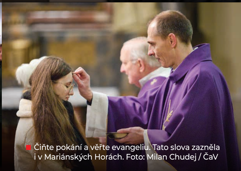
■ Čiňte pokání a věřte evangelium. Tato slova zazněla i v Mariánských Horách.