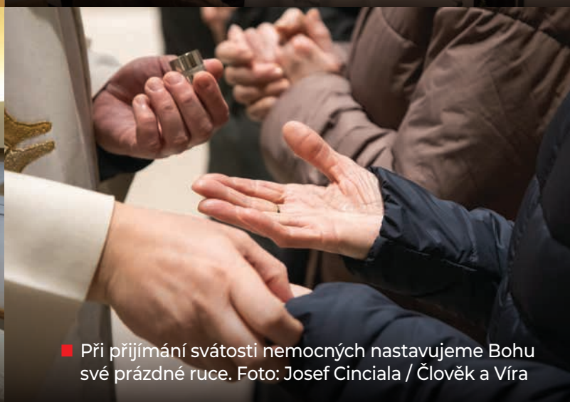
■ Při přijímání svátosti nemocných nastavujeme Bohu své prázdné ruce.