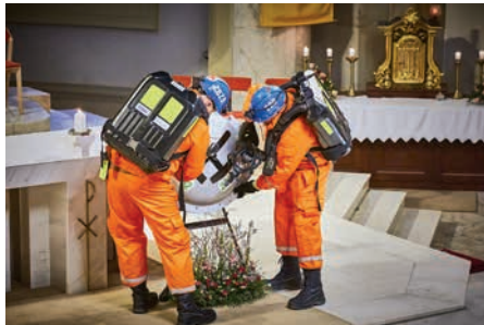
■ Éru těžby zakončila bohoslužba v katedrále, při které se do liturgie zapojili také zástupci důlních profesí a členové hornických spolků.

sela být vždycky na prvním místě. Pravidla byla přísná. Nesmělo se kouřit, nesmělo se chodit s otevřeným ohněm a podobně.