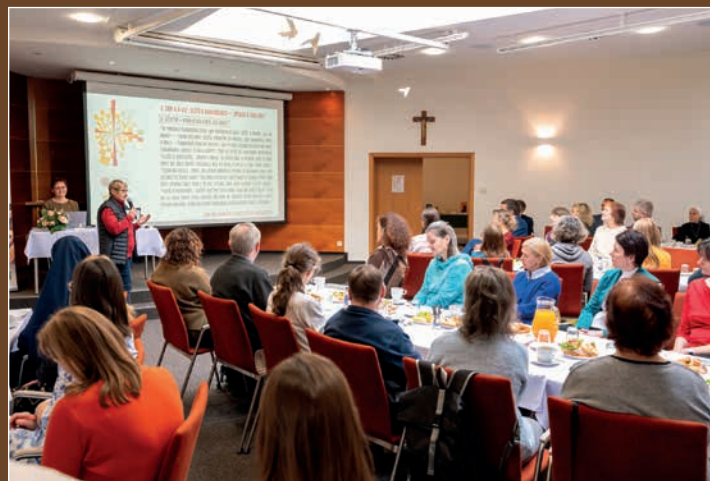
Na závěr Dne pro vyučující náboženství a katechety předal biskup Martin osmi z nich kanonickou misi na dobu neurčitou.