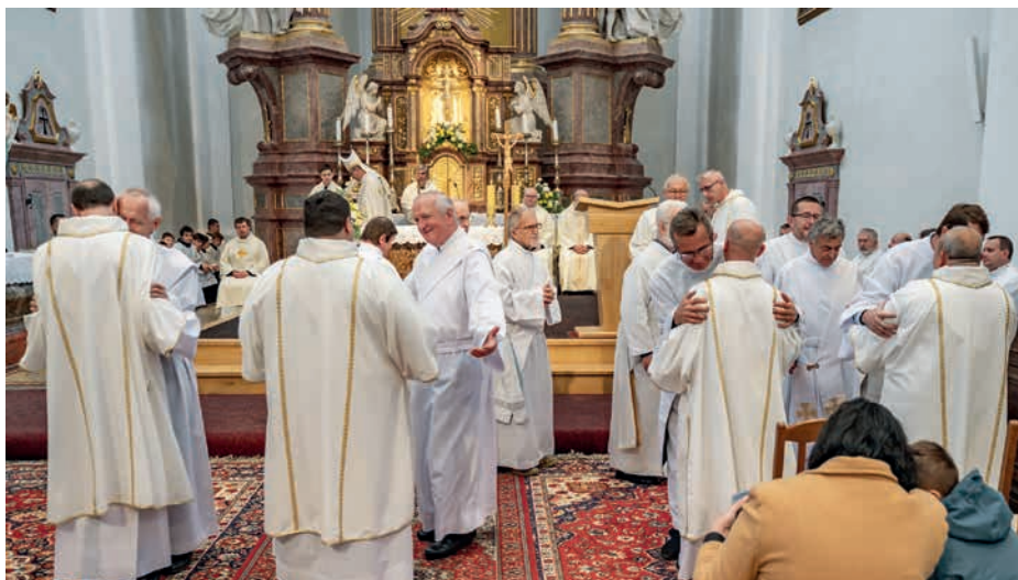
Společenství jáhnů při svěcení nových diakonů loni v říjnu.