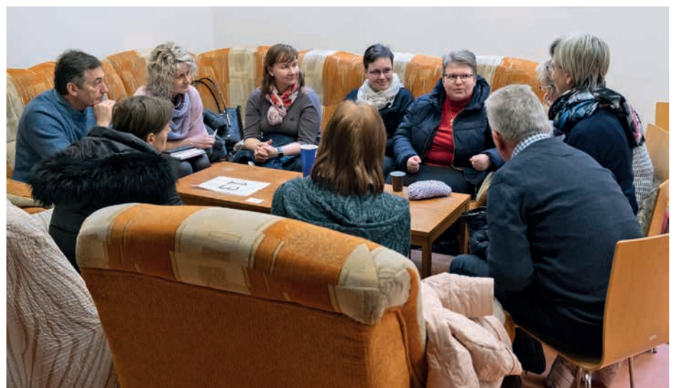
Diskuzní skupinky spojily účastníky, kteří žijí v podobné oblasti. Mohou tak přemýšlet o evangelizaci ve svém okolí. Další dvě části kurzu se uskuteční 8. února a 1. března.