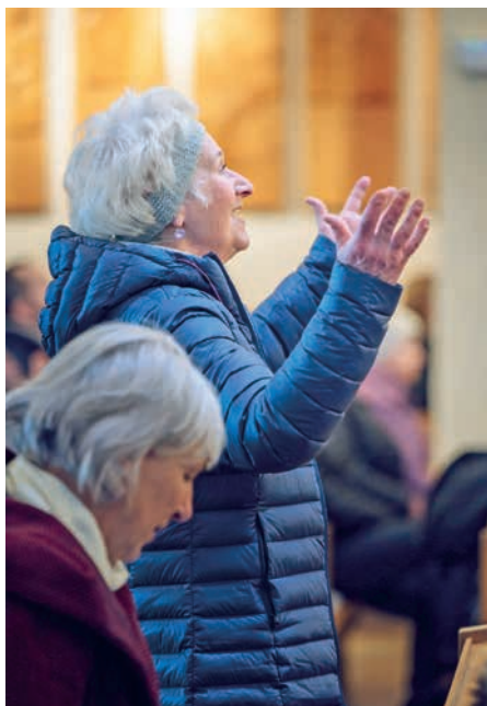
Oblastní setkání charismatické obnovy nestojí na známých jménech. Utvářet ho může každý účastník.