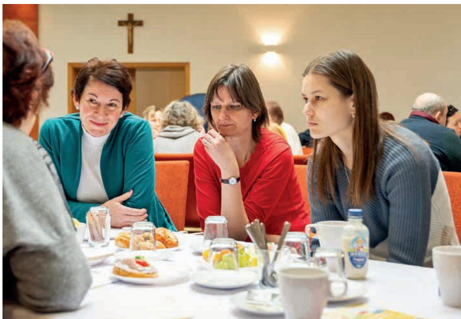
Účastníci diskutovali o současnosti a budoucnosti katecheze v diecézi.

Poobědový čas poté naplnily vzájemná osobní setkání a rozhovory a také nákupy křesťanské literatury a pomůcek. Zúčastnění také listovali novými barevnými učebnicemi „Ptáme se a odpovídáme, hledáme a nacházíme“, kte-