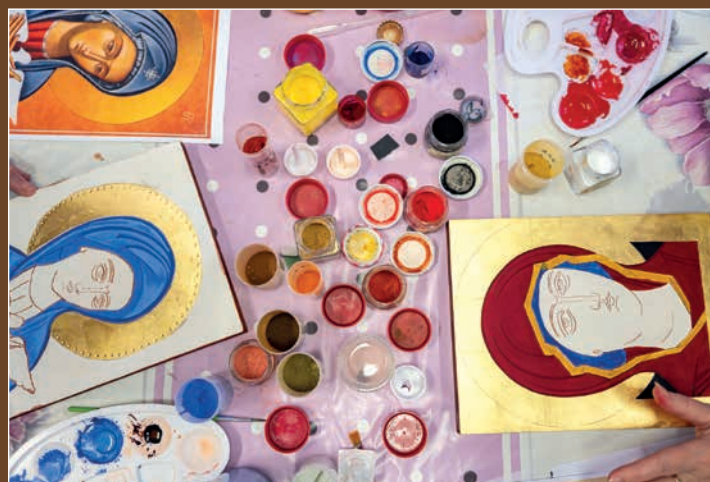
V Místku se koncem ledna uskutečnil Kurz ikonopisu. Každý účastník si domů odnesl vlastnoruční ikonu.