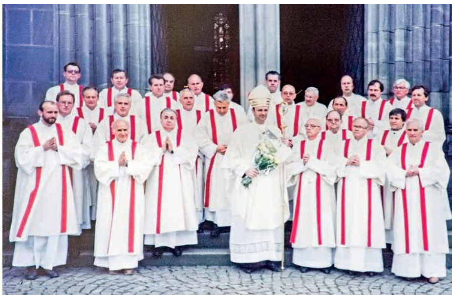
Foto z jáhenského svěcení.