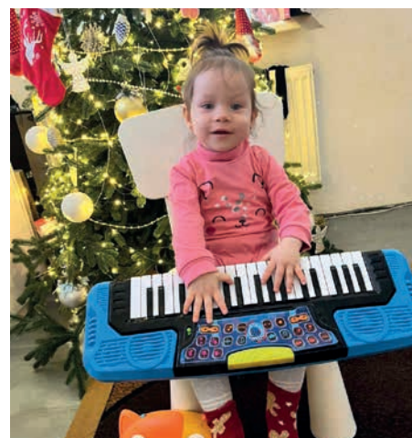
Alhaja z Doněcké oblasti dostala klávesy.