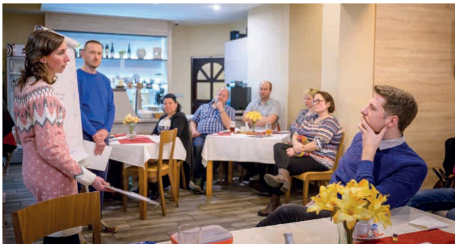
Společný čas a nová témata k diskuzi.

Naše Centrum pro rodinu ve spolupráci s dalšími centry i farnostmi připravilo několik příležitostí, jak našim vztahům věnovat čas a jak je obohatit. Věříme,