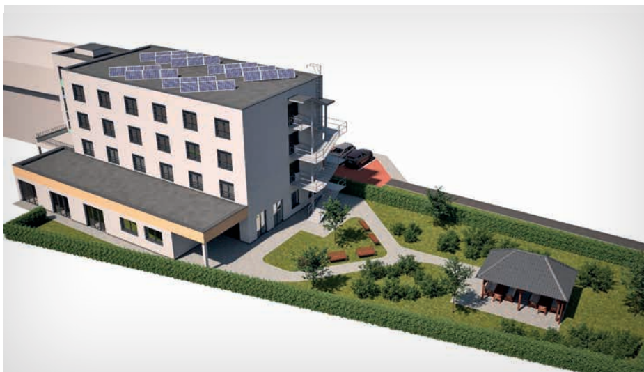
Vizualizace nového Domova sv. Jáchyma, který Charita z velké části financuje z Národního plánu obnovy.

„Ohlasy obyvatel i vedení města jsou velmi pozitivní. Jeden pán se už ptal, zda by sem mohl umístit svou maminku,