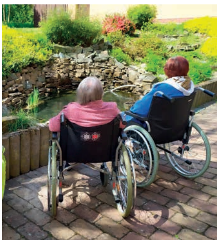
Možnost pobýt na čerstvém vzduchu: to je velký benefit zahrady domova.

Momentálně zaměstnává Charita Studénka 35 lidí, převážně ženy. Kromě studentek sociálně pracovních oborů jsou velkou pomocí také dobrovolníci z řad veřejnosti. Těch by především Do-