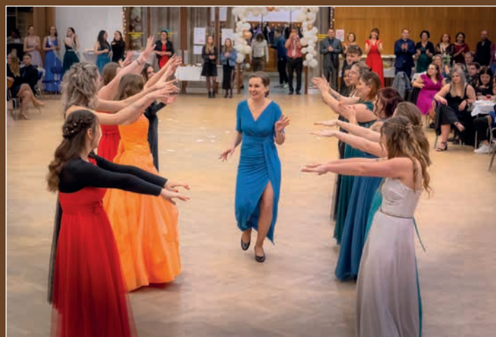
Reprezentační ples se šerpováním maturantů prožila o posledním lednovém víkendu oderská škola sv. Anežky.