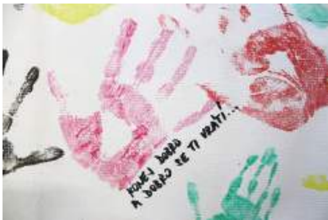
Otisky dlaní dobrovolníků, kteří se v r. 2018 setkali v Ostravě-Třebovicích, na 2. diecézním setkání dobrovolníků Charit.

V ostravsko-opavské diecézi v roce 2018 pomáhaly: