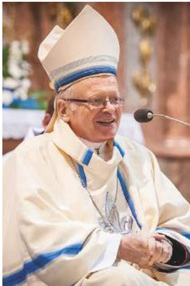
+František Václav Lobkowicz biskup ostravsko-opavský