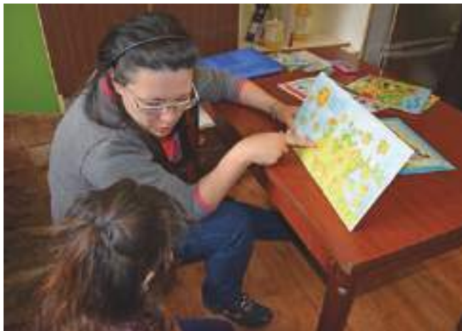
Centrum Prámínek – sociální aktivizační služba pro rodiny s dětmi – pomáhá rodinám, které žijí ve vyloučené lokalitě ul. Míru a blízkého okolí ve Frýdku-Místku. Podporuje rodiče i děti ve snaze o zlepšení jejich nepříznivé sociální situace.

DCHOO vytváří zázemí jednotlivým oblastním Charitám, které v diecézi spravuje. Poskytuje jim metodickou pomoc, plní kontrolní funkci, zastupuje jejich zájmy v rámci kraje a propojuje charitní práci na celostátní a místní úrovni. Mimo tyto služby naplňuje své poslání prostřednictvím vlastních středisek, v nichž se věnuje sociální práci i pomoci v zahraničí.