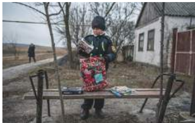
Projekt Mikulášská nadílka organizuje Středisko humanitární pomoci a rozvoj ve spolupráci s DCHOO. V roce 2018 přivezlo chudým dětem z Ukrajiny, které žijí blízko bojových zón, na 200 dárků, a díky českým dárcům se podařilo získat na tyto dárky přes 150 tis. Kč.

DCHOO v roce 2018 uskutečnila již poosmnácté Tříkrálovou sbírku , jejíž výtěžek činil 17 854 822 Kč. Ve spolupráci s farnostmi se podílela na Postní almužně a v květnu společně s Charitou Český Těšín uspořádala Diecézní pouť Charit . Závěr června patřil již 3. ukrajinskému festivalu , který na podporu své činnosti organizuje Středisko humanitární pomoci a rozvojové spolupráce. Po prvním úspěšném ročníku dále DCHOO zopakovala akci pro charitní dobrovolníky , kteří se v září setkali v Ostravě-Třebovicích.